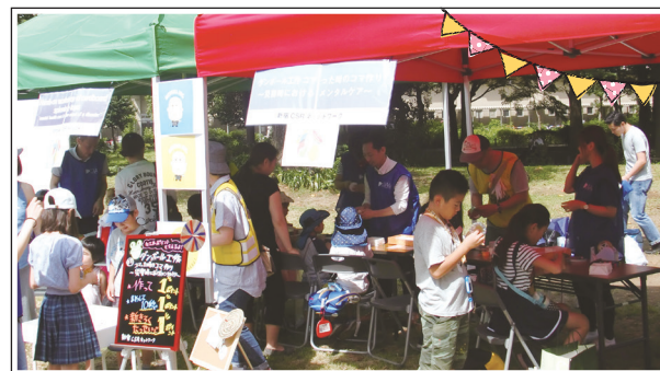
◀ 2017年 「しんじゅく防災フェスタ2017」 廃材利用コマ作りブース