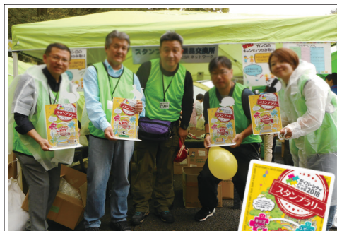
2018年▶ 「ダイバーシティパークIN 新宿 2018」スタンプラリー