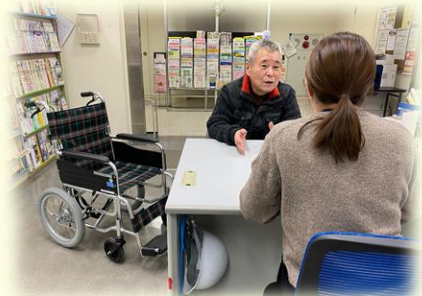
相談を伺いながら車椅子を貸出