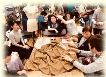
障害のある方との共同ワークショップへの助成

人口の多い自治体と少ない自治体では、集められる募金の額にも差が生まれます。人口の差によって、地域福祉に差が生まれてしまわないよう、赤い羽根共同募金の35%は、都道府県単位で活用されます。