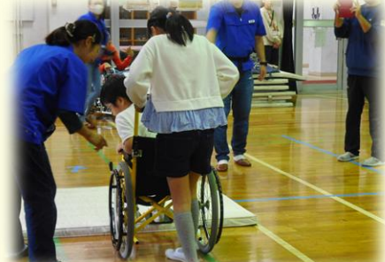
障害当事者に習う車椅子体験学習

「車椅子の貸出」や「地域ささえあい活動の助成金」、「小学生から社会人までを対象とした福祉教育」など、新宿社協が行う多くの事業に共同募金が活用されています。新宿社協では、これら事業を通じて、誰もが安心して暮らせる地域づくりに取り組んでまいります。