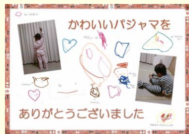
事務局あてにお見舞いへのお礼の手紙をいただきました。

新宿社協の事業を通じて、地域福祉活動の支援や福祉体験学習、ボランティアの体験事業や情報発信、地域への機材・車椅子の貸出などに活用いたします。