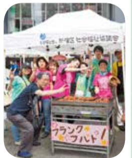
テント・鉄板焼機