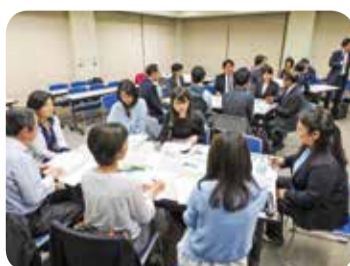
今年度4月に開催した定例会の様子 次回は7月に区内の福祉施設で開催予定

また、ネットワークのメーリングリストを活用し、参加企業同士で地域活動などの情報発信や共有を行っています。