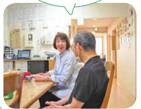
施設訪問中の市民後見人

ご本人からお話しを聞き、施設職員とも相談した上で必要なサービスの契約やお金の管理を行っています。ご本人が目合わせて話してくれることが嬉しいです。市民後見活動は、多くの学びがあり、自分のためにもなる活動です。