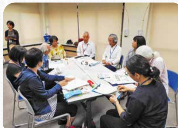
昨年度講座実施時の様子

【対象】区内在住・在勤・在学または区内でボランティア活動したい方で、居場所づくりに興味関心がある方（または区内で居場所づくりの活動をしたい方）