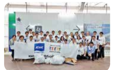
5:ゴ3:ミ0:ゼロ大作戦の様子

新宿CSRネットワークでは、加盟企業様と情報共有をさせていただいたり、地域に密着した活動に参加させていただいています。