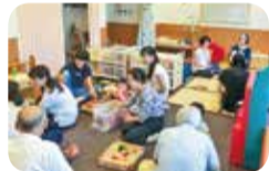
子育てサロンでの活動の様子

特に7月から9月の夏休み期間は、子どもや学生、親子でも参加しやすい活動メニューを用意しています!体験メニューはホームページに掲載しますので、興味のあるボランティア活動から始めてみませんか?活動先の見学もできますので、お気軽にお問合せください。