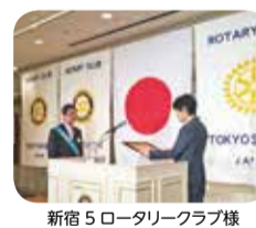
新宿5ロータリークラブ様