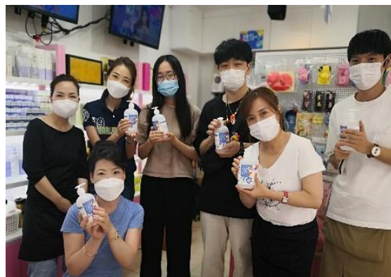
コスメショップ蘭ちゃんの皆さん (株式会社 亜太)

✿ 社会福祉協議会の皆さん 大変だと思いますが、頑張ってください。 いつでも困ったときは相談してくださいね。 サランヘヨ〜♡