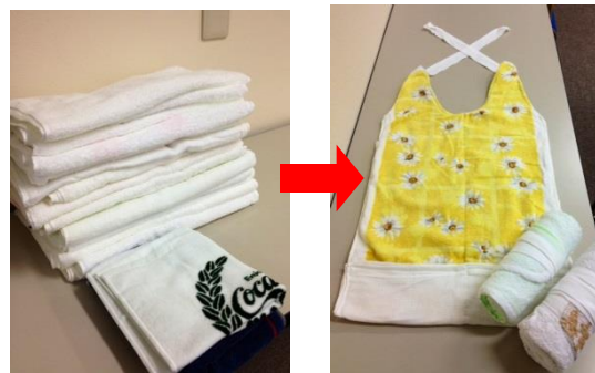
タオルがこのようなエプロンに！