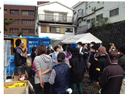
ボランティア希望者への活動説明風景 (伊豆大島災害ボランティアセンターにて)