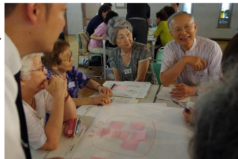
懇談の様子。様々な意見が出ました。

この交流会をきっかけに、顔の見える関係づくりから、新たな活動へ広がる機会となるよう、来年度以降も、東・中央・西地区の各圏域1地区ごとに順次実施していきます。