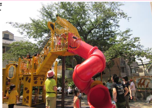
公園のシンボル、キリンの滑り台

なお、この行事は、新宿社協の「地域ささえあい活動助成金」を活用した地域イベントです。新宿社協では、助成金の活用や申請の相談も受け付けています。お気軽にご連絡ください。