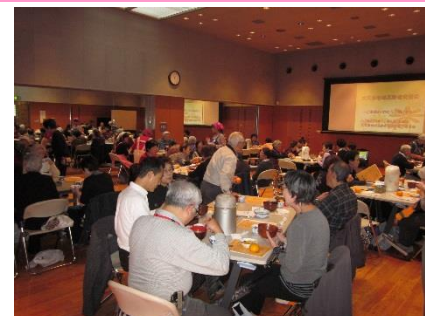
芋煮会の様子(上)と提供された芋煮(右)

地域の民生委員さん、認知症サポーターさん、社協から参加のボランティアさん、大久保高齢者総合相談センターさんの活躍で笑顔いっぱいの交流会でした。