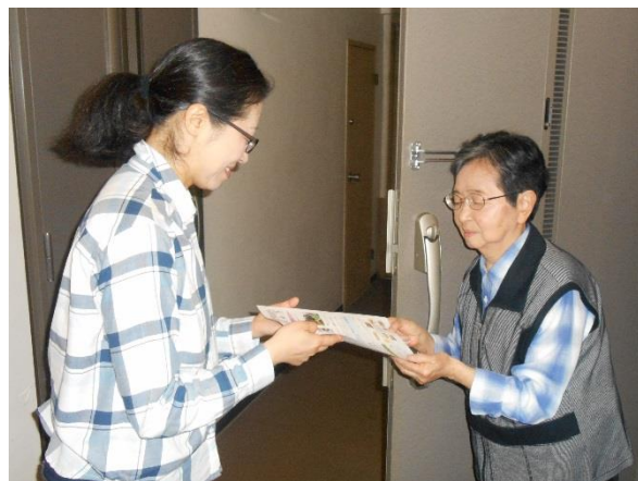
玄関先での見守り活動の様子