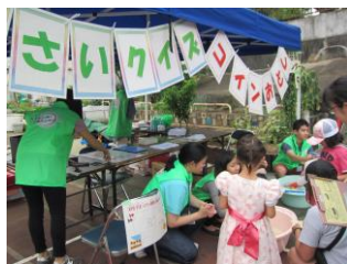
子どもの水遊びイベントで高校生が大活躍！

新宿社協では、年間を通じてボランティア体験ができるよう、引き続き活動メニューを用意します。また、ボランティア入門講座等、初めて活動する方への講座も実施しています。お気軽にご参加ください。