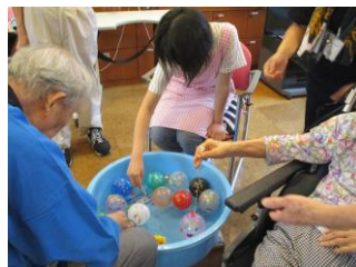
高齢者施設で中学生ボランティアが納涼祭をサポート！

7月から9月の夏休み期間は、区内の施設・団体等にご協力いただき、子どもから親子まで、多くの方がボランティアを体験しました！