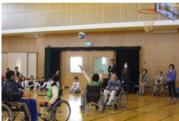
車椅子バスケットボール体験（区立柏木小学校）

新宿社協は、障害者理解教育の授業の事前及び事後学習として、福祉教育・体験学習の企画に協力しています。