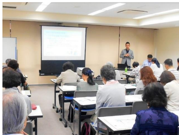
写真：説明会の様子