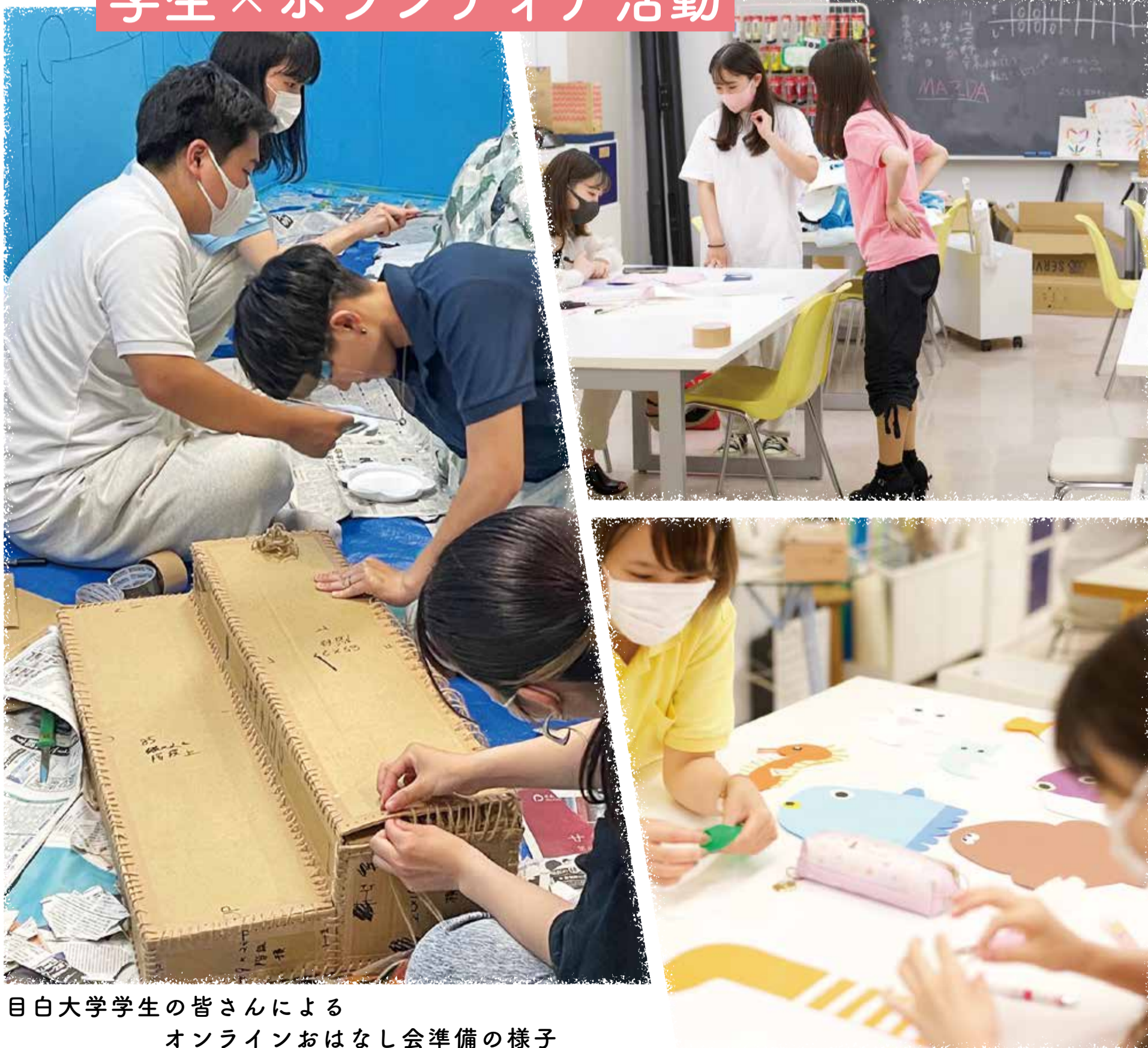
目白大学学生の皆さんによる オンラインおはなし会準備の様子