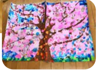
参加者の皆さんとちぎり絵を作りました