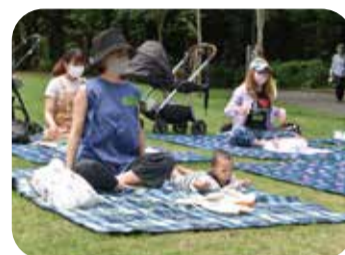
お日様の下で 親子の時間