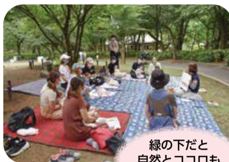
緑の下だと 自然とココロも ほぐれます