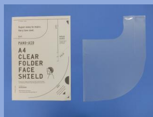
型紙(左)と完成品(右)