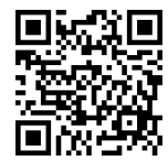
お申込みはこちら

申込：①右のQRコードからお申込み ②電話(03-3359-0051)にてお申込み