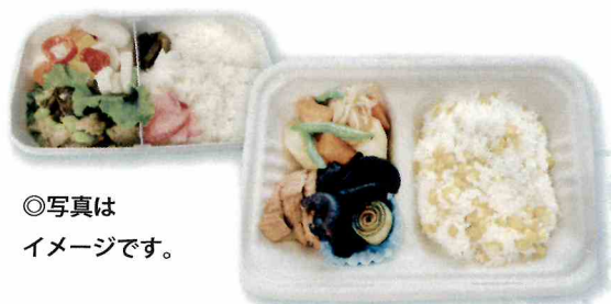
◎写真はイメージです。