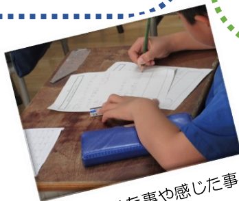
(講師から聞いた事や感じた事をメモしていました)