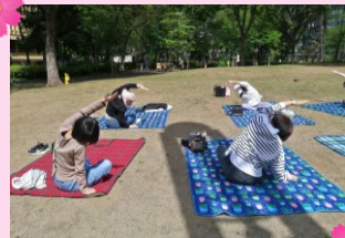
ヨガでリラックス中～♪

「働くママも応援したい！」と、働くママを講師として招くのがHugmomの特徴です。