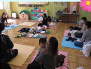
先生もご自身のお子さんを連れて講話されました！