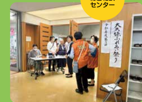
大久保ふれあい祭り