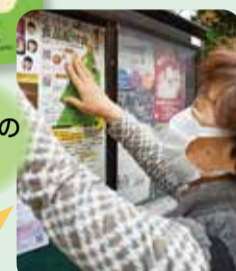
町会・自治会の 掲示板でお知らせ