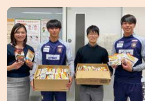
クリアソン新宿 日本ハウズイング株式会社