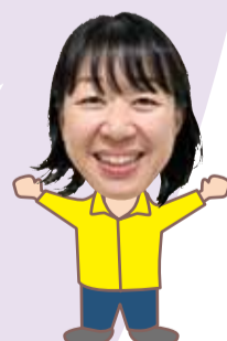
暮らしの 相談窓口担当