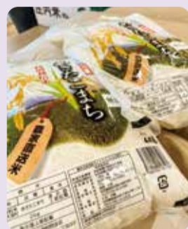
地域の商店や福祉施設からお米やお菓子を手配