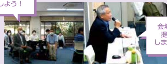
会場を提供 します!