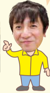
地域活動支援課職員