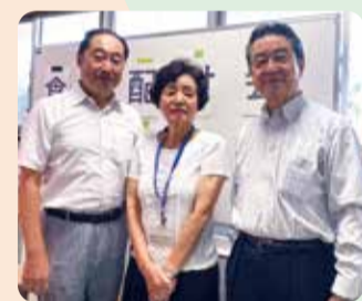
新宿5ロータリークラブ