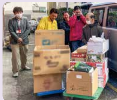
各寄附受付先からの食品回収