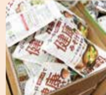
マルコメ株式会社