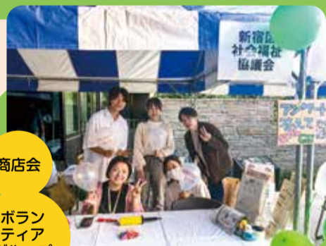
商店会 町会 ボランティア グループ