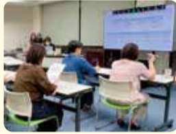
現地地で得た学びを職員間で共有しました