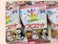
新宿区保護司会四谷分區