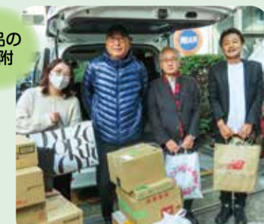
自治会で集めた食品などを持参