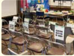
災害ボランティアセンター